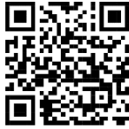
เอกสารประชาสัมพันธ์

๑) การต่อทะเบียนวิสาหกิจชุมชนและเครือข่ายวิสาหกิจชุมชน ประจำปี ๒๕๖๘ ให้เป็นไปตามที่พระราชบัญญัติกำหนดด้วยแพลตฟอร์มทะเบียนวิสาหกิจชุมชนกลางและจดทะเบียนด้วยระบบลายมือชื่ออิเล็กทรอนิกส์ (e – signature) ระหว่างวันที่ ๑ – ๓๐ มกราคม ๒๕๖๘ โดยมีเอกสารประชาสัมพันธ์ ตาม QR Code ด้านล่างนายทะเบียนอาสาสมัครเกษตรหมู่บ้าน ที่ ๑/๒๕๖๗ เรื่อง แต่งตั้งอาสาสมัครเกษตรหมู่บ้าน (อกม.) ลงวันที่ ๗ พฤศจิกายน ๒๕๖๗ เพื่อปรับปรุงประกาศฯ และคำสั่งฯ ดังกล่าว ให้เป็นปัจจุบัน ทั้งนี้ สามารถดาวน์โหลดไฟล์สแกนประกาศฯ และคำสั่งฯ ได้ตาม QR Code ด้านล่าง