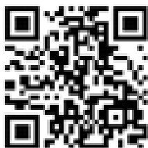
รายละเอียดประชาสัมพันธ์ฯ

๒) ประชาสัมพันธ์คำแนะนำในการป้องกันกำจัดศัตรูข้าว เพื่อให้เกษตรกรนำไปใช้เป็นแนวทางในการป้องกันกำจัด รายละเอียดตาม QR Code