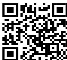
รายละเอียดผล/แผนปฏิบัติงาน

เลขานุการรายงานผล/แผนการปฏิบัติงานประจำเดือนที่สำคัญ รายละเอียดตาม QR Code ด้านล่าง